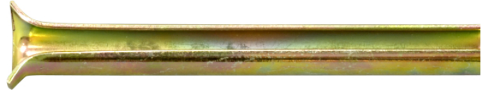
Fix-hylse 6 [mm]: Utvendig diameter er 6,8 for borehull 6,0 Fix-hylse 8 [mm]: Utvendig diameter er 8,8 for borehull 8,0

Fix-hylse hamres gjennom forboret bygningsdel og ned i betong borehull.