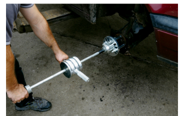
Med 9 kg slaghammer som er tilleggsdel