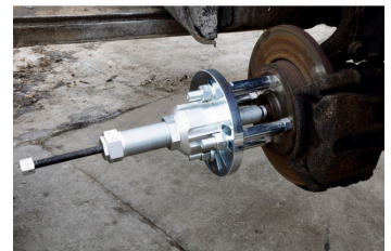
Med hydraulisk spindel som er tilleggsdel